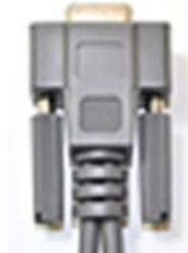
RS232C コイルケーブル（ 2.4m ）