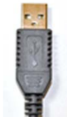
USB ストレートケーブル（ 1.8m ）